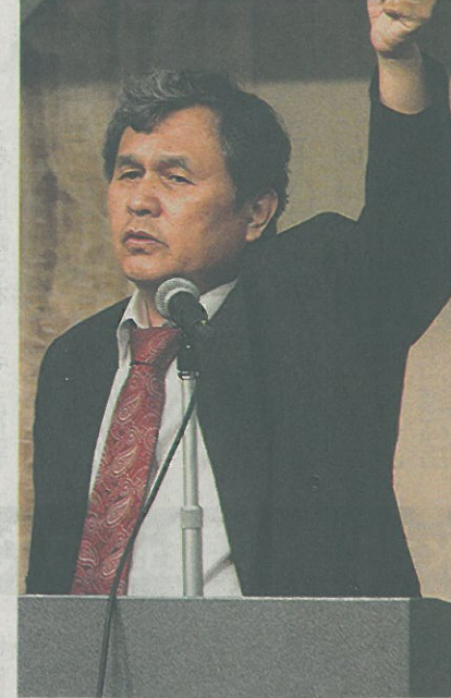
中小企業向け 経験基に語る