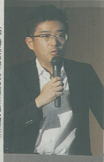
可能性信じて オール西濃で