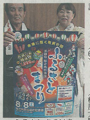
ふるさとまつりを PRする

8日「ふるさとまつり」 輪之内、郡上おどりも来訪 輪之内町の夏祭り「第二十八回納涼 輪之内音頭」を披露する。郡上市の 「郡上おどり八幡おはやしクラブ」が訪 れ、参加者は郡上おどりを教えてもらい ながら一緒に踊ることが出来る。飲食の